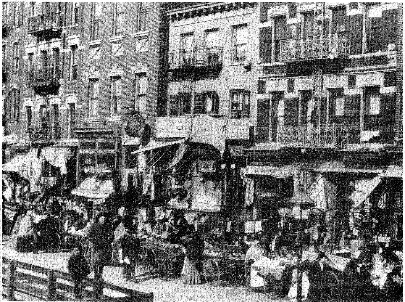
רחוב הסטר, מרחובותיו המרכזיים של האיסט סייד התחתון