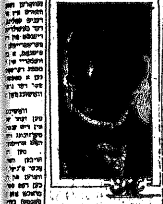
האנונג פאר דא ארבייט

אין דער פארשטיינג פון העלען פאן פארשטיינג